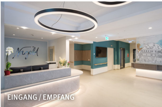
EINGANG / EMPFANG